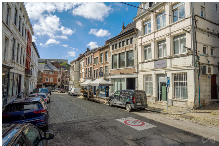
Le mobilier repris sur les photos ne fait pas partie de la vente conformément à l'article 3.9 du nouveau code civil.