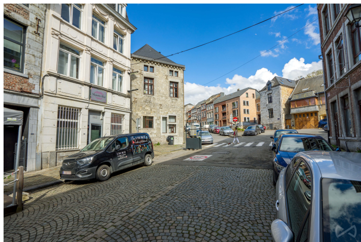
Le mobilier repris sur les photos ne fait pas partie de la vente conformément à l'article 3.9 du nouveau code civil.